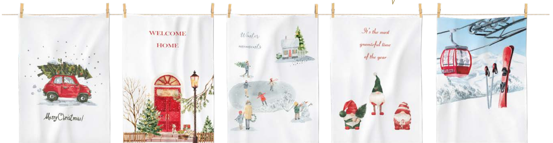
3. GESCHIRRTÜCHER je 6,95

1. BIBER-BETTWÄSCHE: Angenehm wärmend, weich zur Haut und außergewöhnlich im Dessin. Passend zur Jahreszeit bedruckt mit verspielten winterlichen Motiven. Aus 100 % Baumwolle. Mit Reißverschluss. 135 / 200 cm 49,95, 155 / 220 cm 59,95. 2. FLANELL-BETTWÄSCHE: Gemütlicher geht's nicht. Hübsches Karomuster in warmen Farben und kuschelweicher Flanellqualität bringt Entspannung und Wohlfühlatmosphäre ins Bett. Aus 100 % Baumwolle. Mit Reißverschluss. 135 / 200 cm 69,95, 155 / 220 cm 89,95. 3. GESCHIRRTÜCHER: Vielseitige Küchenhelfer, die optische Akzente setzen. Schön praktisch und saugfähig in fünf süßen, vom Winter inspirierten Dessins. Aus 100 % Baumwolle. 50 / 70 cm je 6,95. 4. DAMEN-PYJAMA: Bequeme Begleitung für kühle Nächte und fast zu schön, um nur darin zu schlafen. Geschmeidige, atmungsaktive Jersey-Qualität in vier bezaubernden Varianten. Aus 100 % Baumwolle. Größen: S bis XL je 29,95.