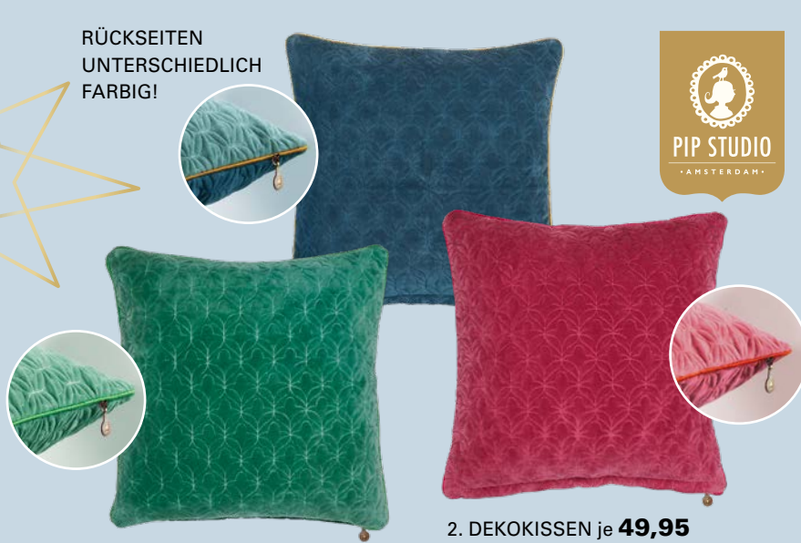
2. DEKOKISSEN je 49,95