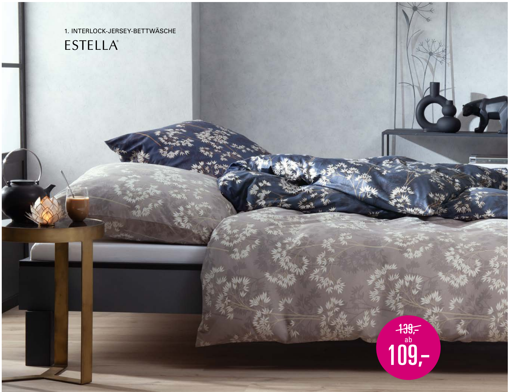
1. INTERLOCK-JERSEY-BETTWÄSCHE ESTELLA®